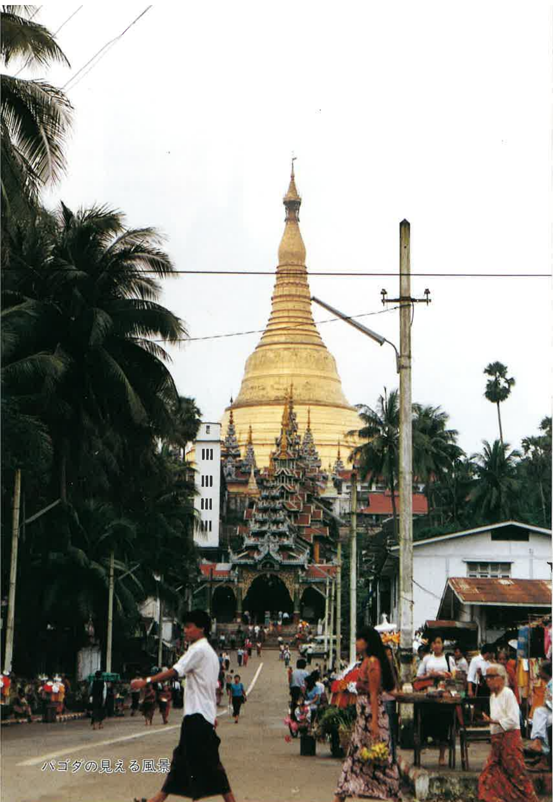
パゴダの見える風景