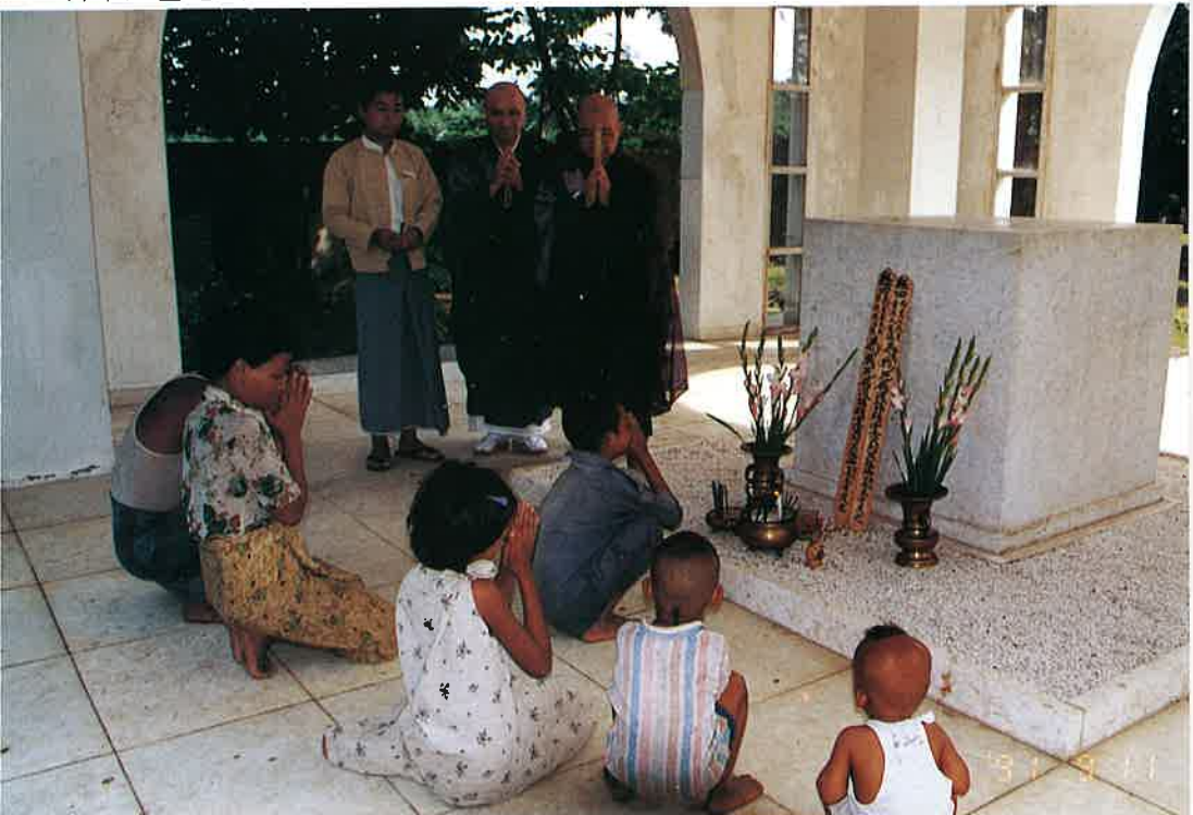
▼居合わせたビルマ人親子も合掌