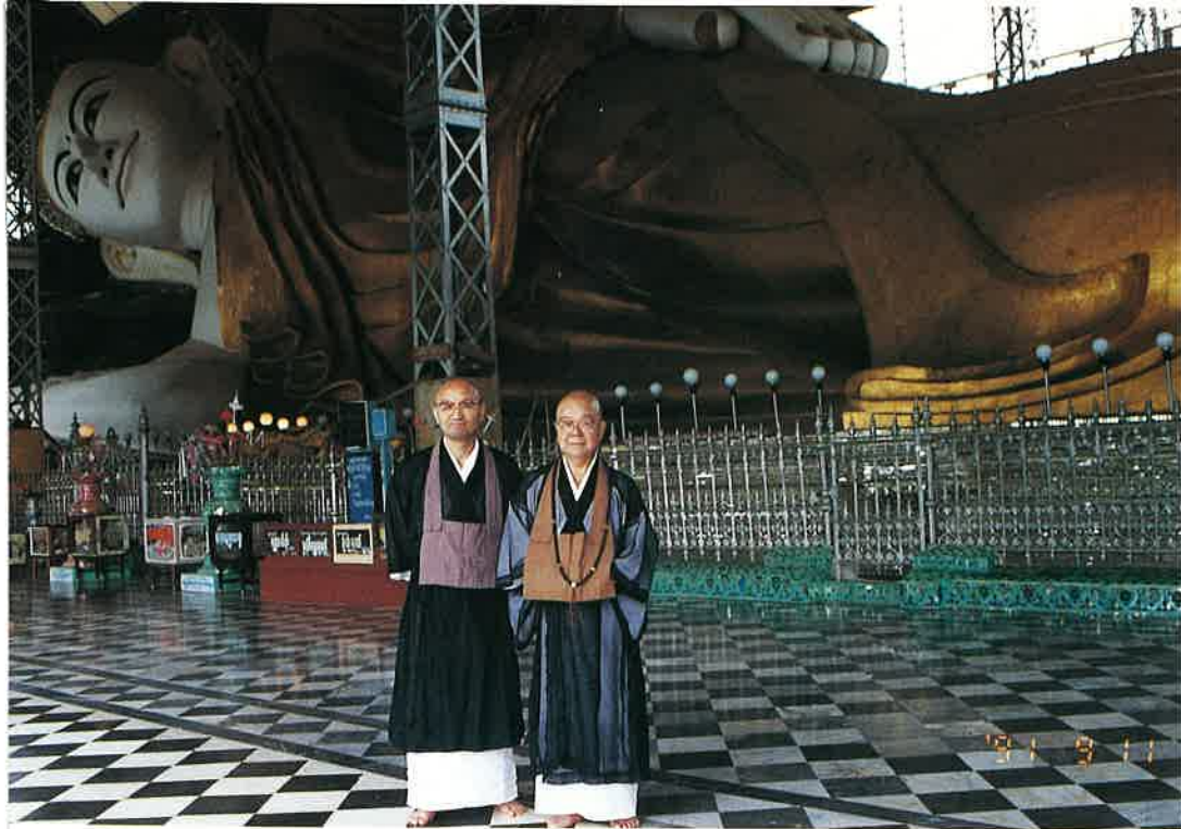
▲寝釈迦仏の前にて