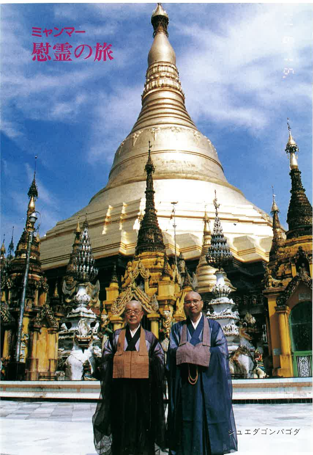
シュエダゴンパゴダ